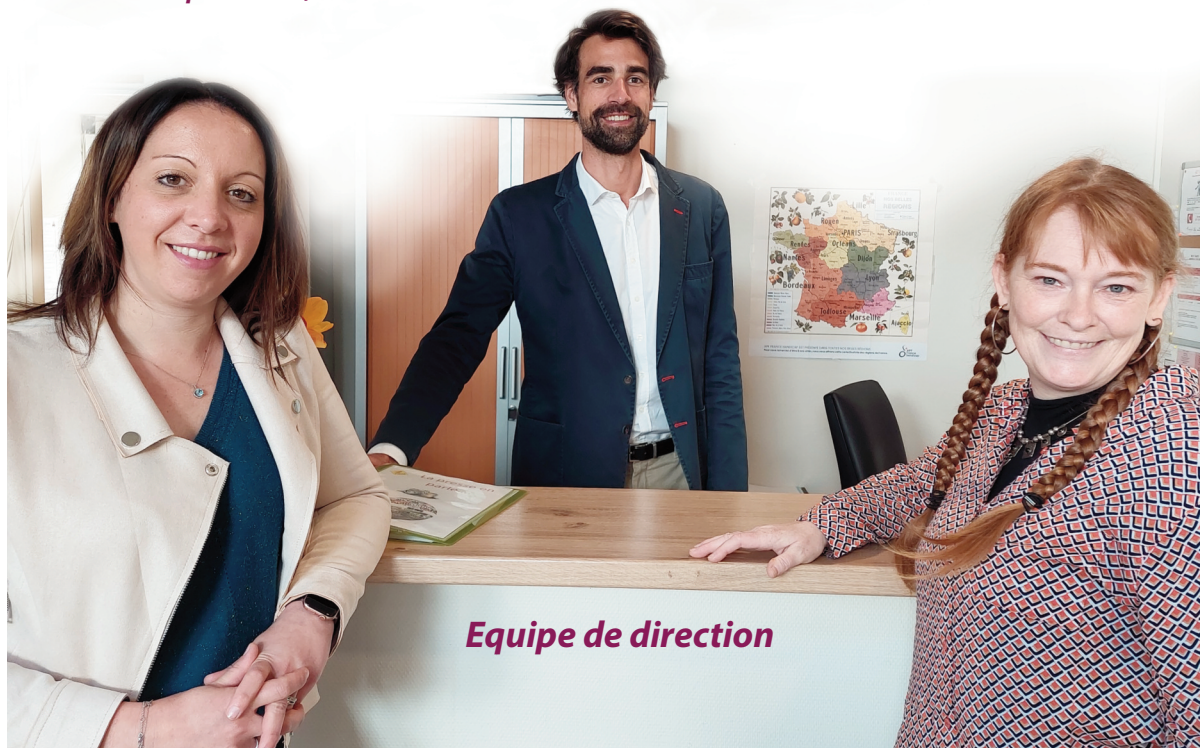
Equipe de direction

La direction et ses équipes vous souhaite la bienvenue à la résidence Harmonie. Notre maison à taille humaine est un lieu chaleureux, dynamique et ouvert sur l'extérieur. Respect, partage, bien-être et transparence sont les valeurs que nous faisons vivre au quotidien, dans une ambiance familiale.